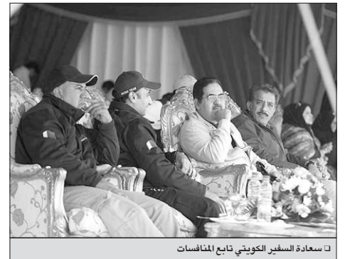
سعادة السفير الكويتي تابع المنافسات